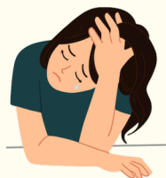
Choro sem causa aparente