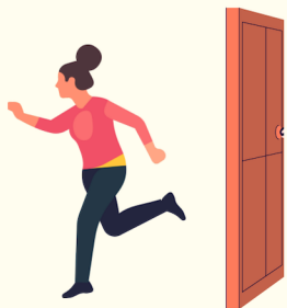
Fuga de casa

Você sabia que a criança ou o adolescente pode estar sendo vítima de violência? Veja alguns indícios que a vítima pode apresentar.